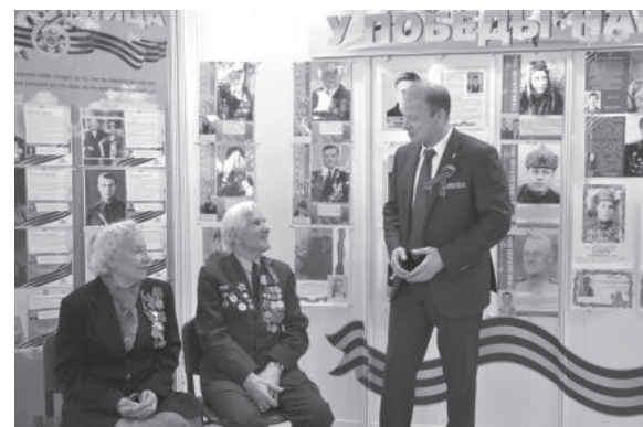
С Днем Великой Победы!

Здоровья вам, дорогие наши ветераны, труженики тыла, дети войны! Успехов нашим воинам, проходящим службу в рядах Вооруженных сил! И всем нам – мирного неба, майского солнца, доброты в душах и тепла в сердце!